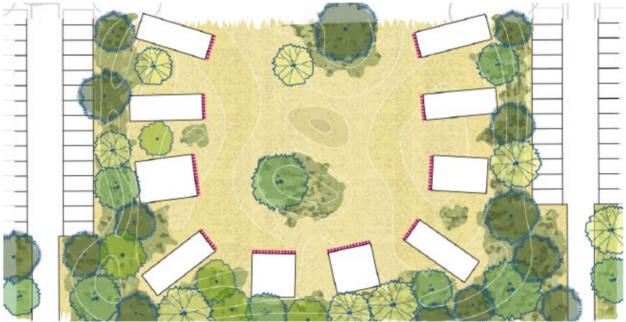
Figuur: Voorbeeld uitwerking duinbos