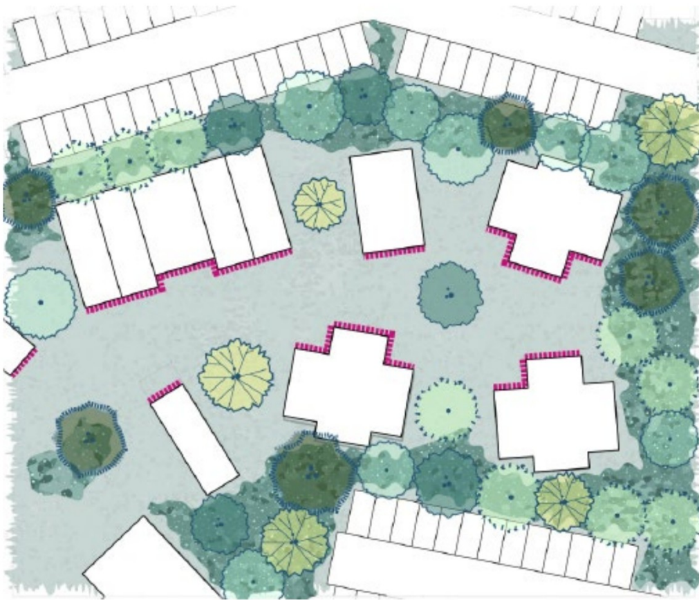
Figuur: Voorbeeld uitwerking kreekbos