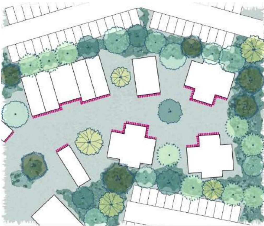
Figuur: Voorbeeld uitwerking kreekbos