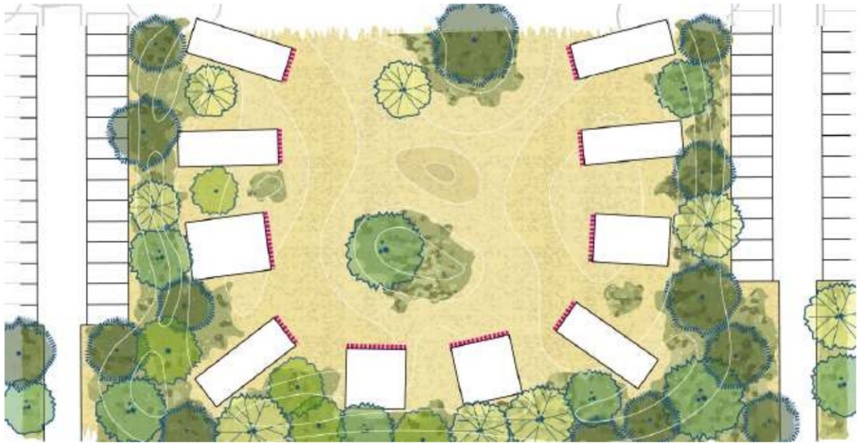
Figuur: Voorbeeld uitwerking duinbos